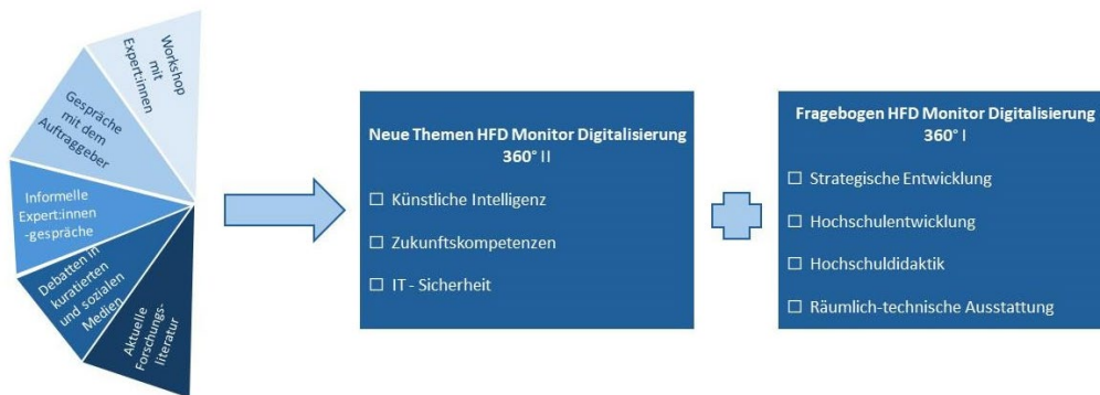
Abbildung 1: Schematischer Ablauf der Fragebogenentwicklung.

Für die neuen Items und Skalen wurden zunächst interessante Fragestellungen aus bestehenden Fragebögen gesichtet und übernommen, thematisch neu sortiert und dann diskutiert. Dies erfolgte sowohl im Hinblick auf ihre Passung zum eigenen Forschungsinteresse als auch im Hinblick auf die Möglichkeit, Itembatterien und Skalen zu übernehmen. Hierbei wurden die bereits aus bestehenden Fragebögen bekannten Fragestellungen für den Monitor verdichtet, auf das eigene Erkenntnisinteresse in ihren Formulierungen angepasst und wo möglich oder notwendig zusammengefasst. Fehlende Fragen, Items und Skalen wurden durch eigene Formulierungen ergänzt.